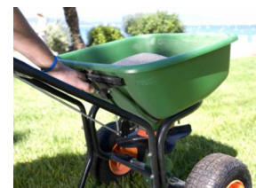
Epandage facile des granules à l'aide d'un épandeur conventionnel.

*Prix en CHF, 2.5% TVA non incluse, livraison franco à partir de CHF 500.- (valeur marchandise)